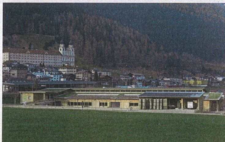
Le projet agricole de l'abbaye de Disentis a, lui aussi, recueilli les faveurs des experts.

«Les huit travaux primés montrent qu'un aménagement viable de notre cadre de vie est possible»